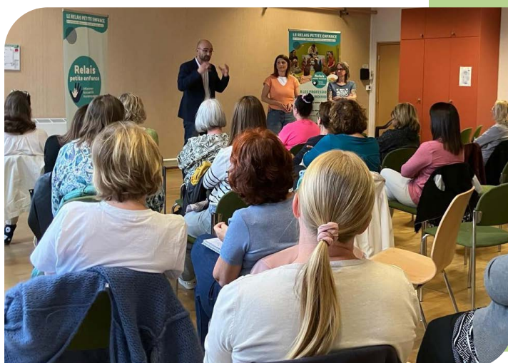
27 avril : Réunion de sensibilisation au handicap à destination des professionnels de la garde d'enfants

Proposer des activités adaptées aux besoins des enfants (sport, musique, médiation animale) : le projet suscite déjà l'intérêt de plusieurs associations dont l'École de Musique et de Danse, le Cercle Athlétique de Boulay et le Club de Handball de Falck.